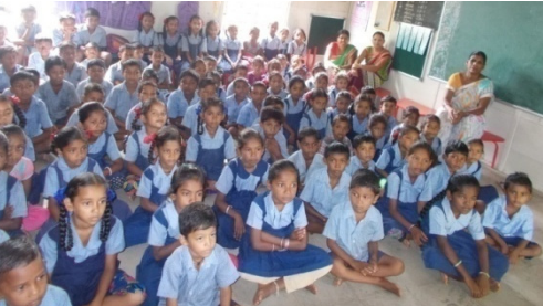
ખાંભલા પ્રા.શાળાના બાળકો વિડીયો જોઈ રહ્યા છે.