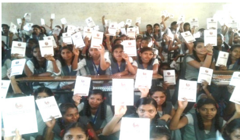
કિશોરીઓ 'કિશોરાવસ્થાની મુંઝવણો' ની પુસ્તિકા સાથે