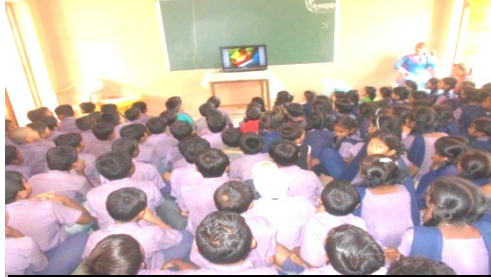
કેવડી પ્રા.શાળાના બાળકો “મીનાની ત્રણ ઈચ્છા” વિડીયો જોઈ રહ્યા છે.