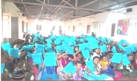
કિશોરીઓ ફલાલીન કાપડની કીટ સાથે

➤ ઘણી શાળાઓમાં ભાઈઓ અને બહેનોની અલગ શિબિર કરવામાં આવે છે.