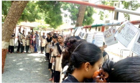
કિશોરીઓ કિશોરાવસ્થાને લગતા પોસ્ટરો વાંચી રહ્યા છે.