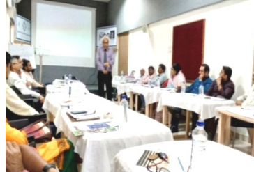
નવસારીમાં કાર્યક્ષમ એન. જી. ઓ. મેનેજમેન્ટ ટ્રેનિંગ