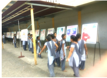
સ્વામી વિવેકાનંદ વિશેના પોસ્ટરો જોઈ રહ્યા છે.