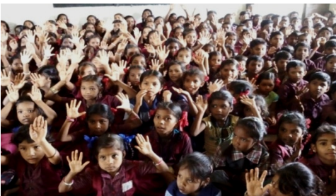
નિરપણ પ્રા.શાળાના બાળકો પ્રતિજ્ઞા લઈ રહ્યા છે.