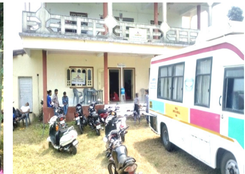
રામકૃષ્ણ સંવેદના ટ્રસ્ટની ઓફિસ પર દાંતના કેમ્પનો દિવસ