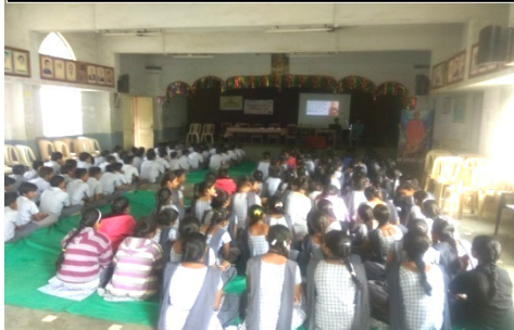
સ્વામી વિવેકાનંદ જીવન સંદેશ અને વ્યસનમુક્તિ અંગેની વીડીઓ જોઈ રહ્યા છે.