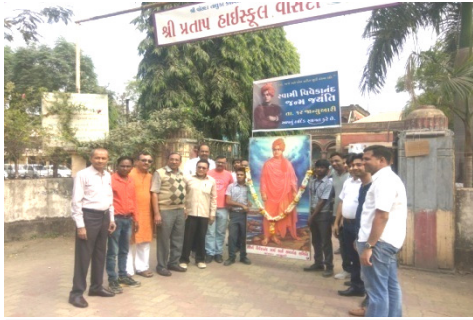
સ્વામી વિવેકાનંદ જન્મ જયંતી ના દિવસેની રેલી

દરેક શાળાઓમાં તરુણ સ્વાસ્થ્યની વાતચીત સાથે સ્વામી વિવેકાનંદ અને વ્યસનમુક્તિ અંગેની વિડીયો બતાવવામાં આવે છે અને વ્યવસાયલક્ષી શિક્ષણ અંગે પણ માર્ગદર્શન આપવામાં આવે છે.