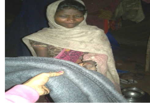
શિયાળામાં ૧૯૦ થી વધુ ગરમ ધાબળાનું વિતરણ

શિયાળામાં ૧૯૦ થી વધુ ધાબળાઓ તથા અન્ય કપડાઓનું છેવાડાના ગરીબ પરિવારોને વિતરણ કરવામાં આવ્યું હતું.