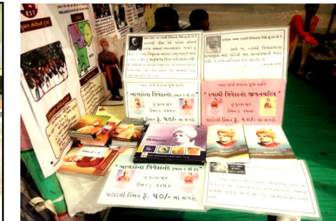
વિશિષ્ટ ડિસ્કાઉન્ટ સાથે પ્રદર્શન અને વેચાણ