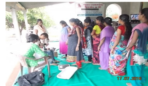
જનરલ કેમ્પમાં આવેલા દર્દીઓ રજીસ્ટ્રેશન કરાવી રહ્યા છે.