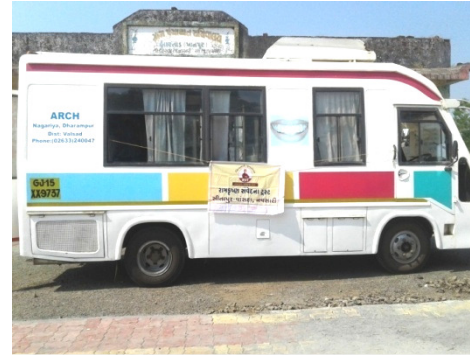
દાંતની આધુનિક એસી બસ