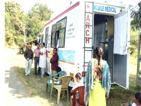
ઊડાણનું ખાટાઆંબા ગામમાં દર્દીઓ સારવાર માટે આવ્યા છે.