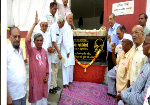
ગાંધી મેળો નવસારીના સામાજિક કાર્યકરો