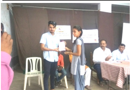
રામકૃષ્ણ સંવેદના ટ્રસ્ટની વકૃત્વ સ્પર્ધામાં ભાગ લેનારા વિદ્યાર્થીઓને ઇનામ વિતરણ