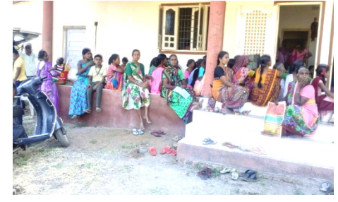
રામકૃષ્ણ સંવેદના ટ્રસ્ટની ઓફિસ પર આંખના ઓપરેશન પછી તપાસ માટે આવેલા દર્દીઓ